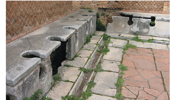
Die öffentlichen Latrinen in der Hafenstadt Ostia, Italien