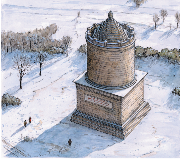
Rekonstruktion des Drusussteins von André Brauch